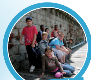
Petite pause à l'ombre des remparts de la ville close !