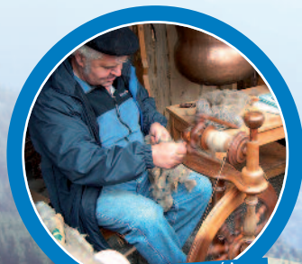
On découvre les vieux métiers et les secrets des artisans d'antan !

La visite guidée de musées retrace et fait revivre le passé de la montagne. Les métiers d'antan sont racontés aux enfants par des intervenants attachés à l'histoire de leur pays. Des diaporamas, des documents d'époque et la présentation d'objets insolites et pittoresques permettent aux enfants de comprendre la richesse du patrimoine humain et culturel de la région. ■