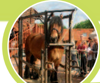
Le musée de la vie rurale de Steenwerck

A partir de 569€ par enfant pour le séjour avec voyage en train départ Paris