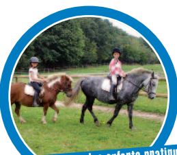
Lors du séjours, les enfants pratiquent plusieurs séances d'équitation.

Initiation à l'équitation. A cheval ou à poney, les enfants apprennent à équiper leur monture, la brider et la sceller. Lors des premières séances, ils apprennent l'équilibre puis travaillent différentes figures en manège ou carrière. Pour les plus jeunes, une balade en calèche à travers les champs est propice à la découverte de la campagne. ■