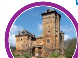
Au Cœur de l'Aveyron, le château de Colombier offre aux visiteurs de multiples activités : jardin médiéval, musée, zoo, ...

Certains seigneurs du Moyen-âge avaient un ours apprivoisé dans leur chambre à coucher, comme le chasseur Gaston Phebus, Comte de Foix.