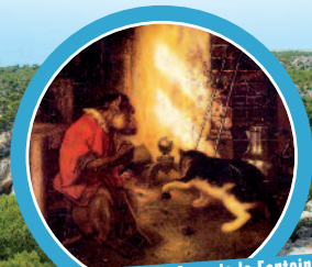
Avec le musée Jean de la Fontaine les animaux sont à l'honneur !

A partir de 439€ par enfant pour le séjour transport car grand tourisme