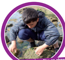
Le jeu des marées offre un observatoire naturel incroyable sur la diversité du vivant...