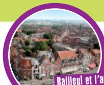
Bailleul et l'architecture caractéristique de la Flandre

A partir de 236€ par enfant pour le séjour (hors transport)