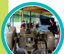
Visite guidée du musée mémorial d'Omaha Beach