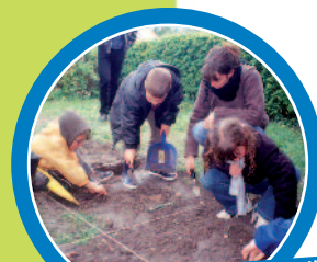
Nos jeunes archéologues en pleine action : quels trésors vont-ils trouver ?