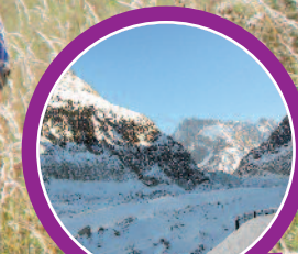
La mer de glace nous offre un spectacle à couper le souffle !

A partir de 429€ par enfant pour le séjour (hors transport)