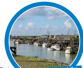
L'île de Noirmoutier permet de belles promenades pittoresques...