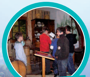
La visite du musée Paysan nous fait découvrir d'incroyables outils !