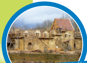
Le château de Guédelon permet de découvrir tous les corps de métiers nécessaires à sa réalisation : il s'agit d'un concept unique !

A partir de 430€ par enfant pour le séjour (hors transport)