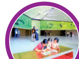
Le Mémorial de Vendée permet de découvrir l'histoire et les richesses de la région de manière ludique...

A partir de 357€ par enfant pour le séjour (hors transport)