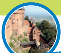
Le château du Haut-Koenigsbourg

A partir de 445€ par enfant pour le séjour (hors transport)