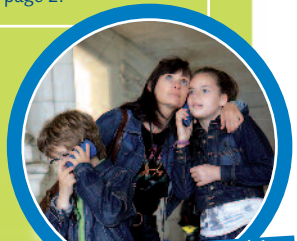
Quel que soit le château visité, les axes pédagogiques sont innombrables...