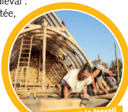
On peut observer le travail du charpentier en pleine action !

Ateliers médiévaux. Accompagné des animateurs, chaque enfant confectionne son propre costume de chevalier, ainsi que son bouclier. Ils choisissent leurs écussons parmi plusieurs dessins et couleurs puis le peignent sur leur tunique à l'aide de pochoir. Ils décorent également eux mêmes leurs boucliers. En fin de séjour, un repas médiéval est offert à tous les chevaliers : assiette et verre en grès avec pour seuls couverts une cuillère à soupe et un couteau, menu médiéval : terrine, potée, tartes... ■