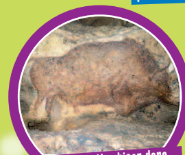
Représentation d'un bison dans la grotte de Font-de-Gaume en Dordogne