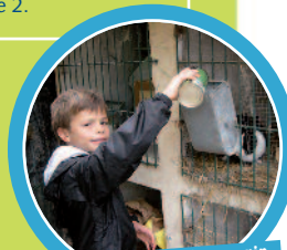
Le bonheur simple de nourrir soi-même les animaux de la ferme !

A partir de 239€ par enfant pour le séjour (hors transport)