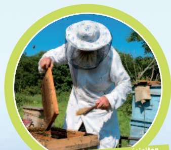
On aurait bien envie de se précipiter sur ce bon miel, mais prudence gardons !

A partir de 379€ par enfant pour le séjour (hors transport)