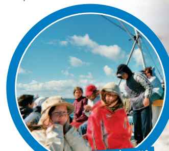
Une promenade en chalutier avec des pêcheurs, ça c'est l'aventure !