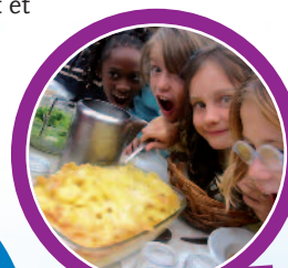
La montagne, ça creuse ! Rien de mieux qu'une bonne tartiflette pour repartir !