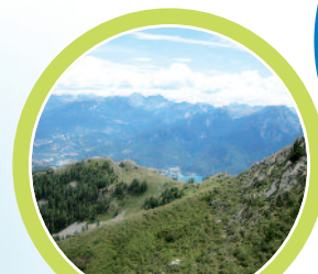
Avec de tels paysages, chacun se sensibilise au respect de la nature.