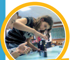
Les ateliers permettent de réaliser de nombreuses expériences...