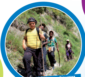
Lors des randonnées, on découvre les richesses de la faune et de la flore.