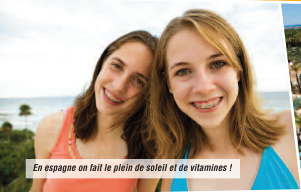
En Espagne on fait le plein de soleil et de vitamines !