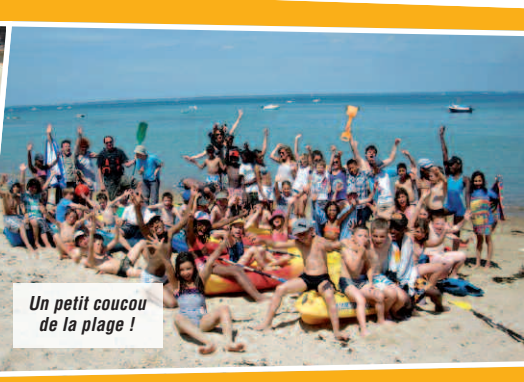
Un petit coucou de la plage !