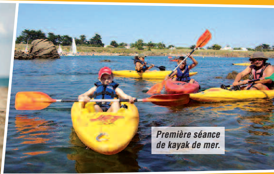
Première séance de kayak de mer.