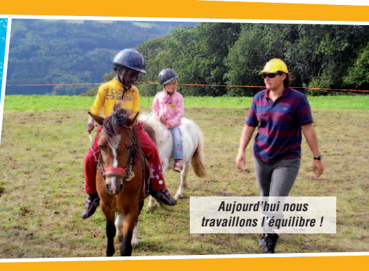
Aujourd'hui nous travaillons l'équilibre !