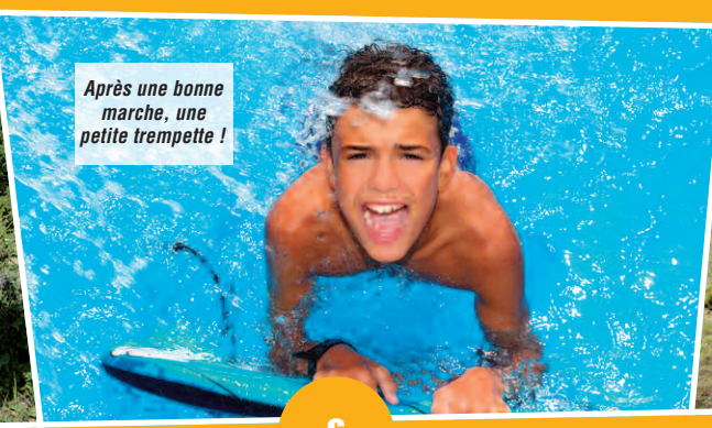
Après une bonne marche, une petite trempette !