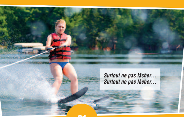
Surtout ne pas lâcher... Surtout ne pas lâcher...