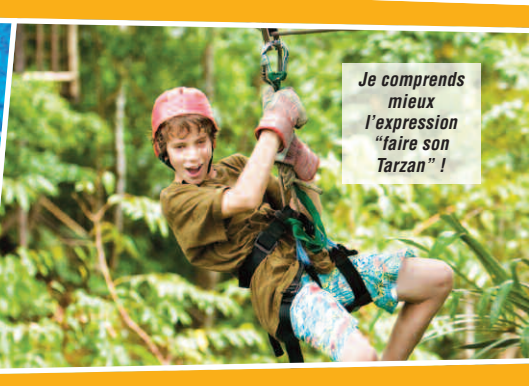
Je comprends mieux l'expression "faire son Tarzan" !