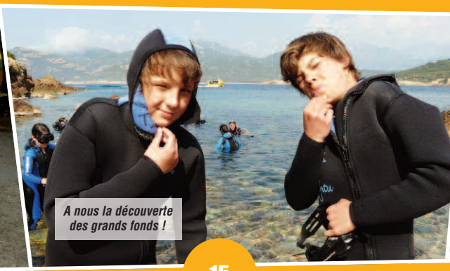
A nous la découverte des grands fonds !