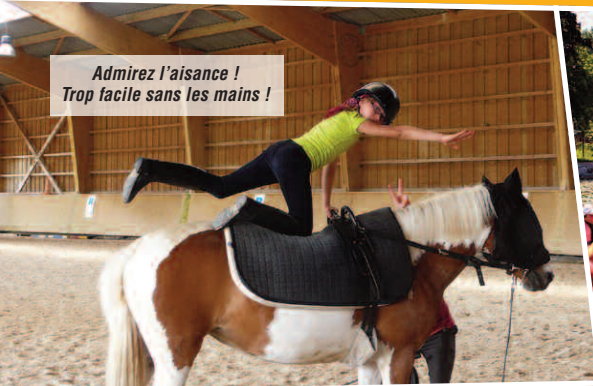
Admirez l'aisance ! Trop facile sans les mains !