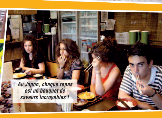
Au Japon, chaque repas est un bouquet de saveurs incroyables !