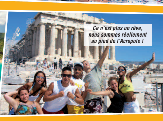
Ce n'est plus un rêve, nous sommes réellement au pied de l'Acropole !