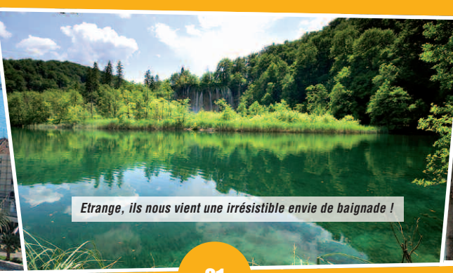
Etrange, ils nous vient une irrésistible envie de baignade !