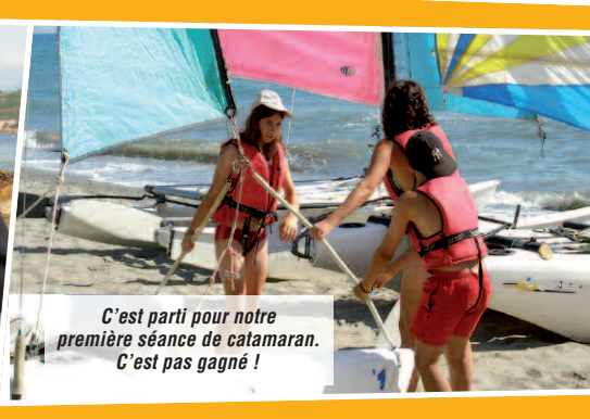
C'est parti pour notre première séance de catamaran. C'est pas gagné !