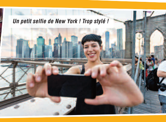
Un petit selfie de New York ! Trop stylé !