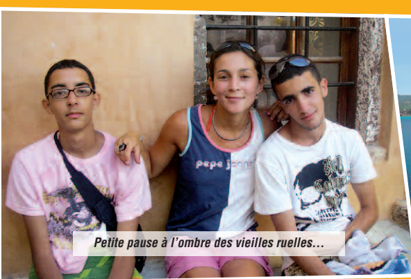
Petite pause à l'ombre des vieilles ruelles...