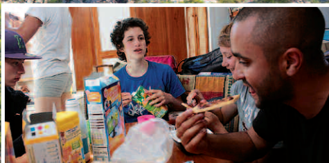
Le grand air du large, ça creuse ! On est devenu des pros du p'tit-déj bien copieux !