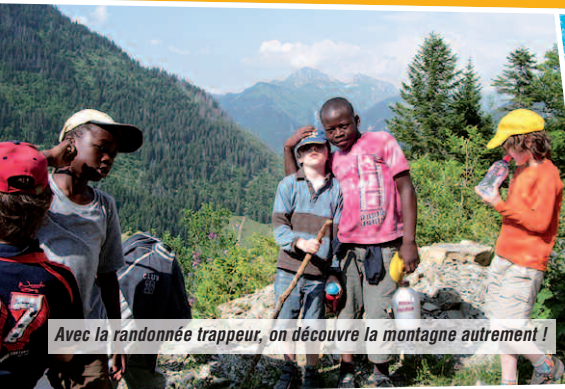
Avec la randonnée trappeur, on découvre la montagne autrement !

● Autres activités. 1 sortie à la piscine de Boège (2 pour les séjours de 14 jours), visite de la ferme/fromagerie du village, fabrication de confiture, ... Des activités manuelles, jeux de société, temps calmes, veillées rythment également le séjour. ■