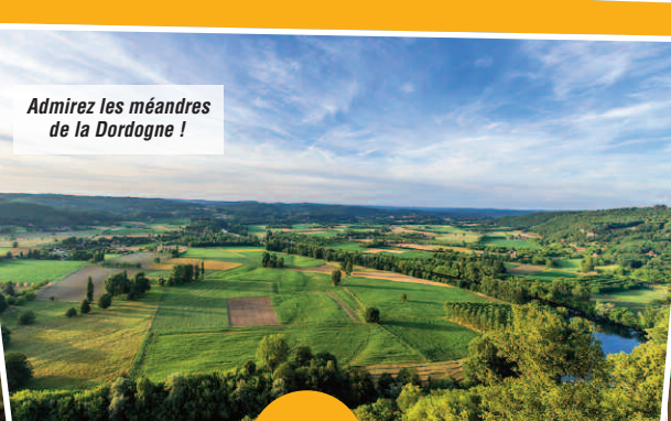
Admirez les méandres de la Dordogne !