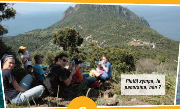
Plutôt sympa, le panorama, non ?