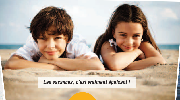
Les vacances, c'est vraiment épuisant !