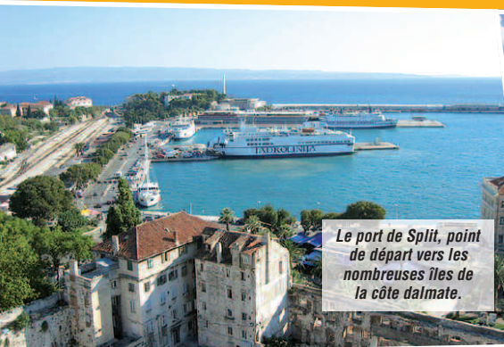
Le port de Split, point de départ vers les nombreuses îles de la côte dalmate.