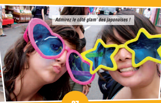
Admirez le côté glam' des japonaises !