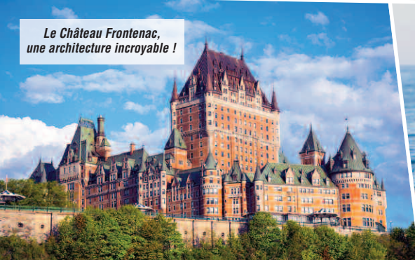
Le Château Frontenac, une architecture incroyable !