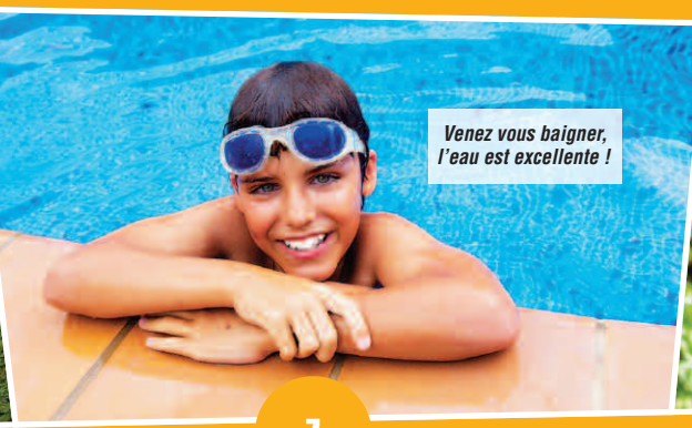
Venez vous baigner, l'eau est excellente !