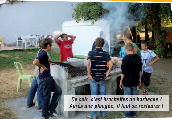
Ce soir, c'est brochettes au barbecue ! Après une plongée, il faut se restaurer !