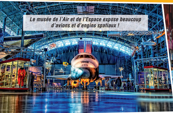
Le musée de l'Air et de l'Espace expose beaucoup d'avions et d'engins spatiaux !