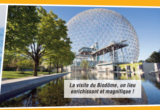
La visite du Biodôme, un lieu enrichissant et magnifique !