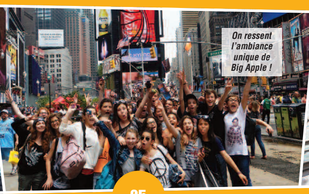
On ressent l'ambiance unique de Big Apple !