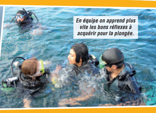
En équipe on apprend plus vite les bons réflexes à acquérir pour la plongée.