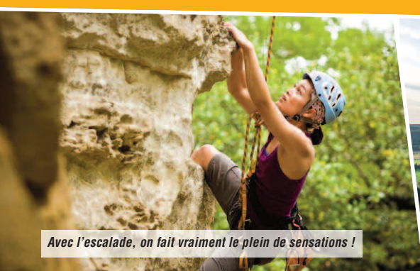
Avec l'escalade, on fait vraiment le plein de sensations !