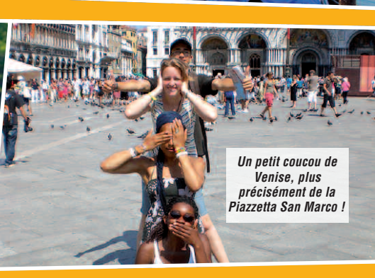
Un petit coucou de Venise, plus précisément de la Piazzetta San Marco !