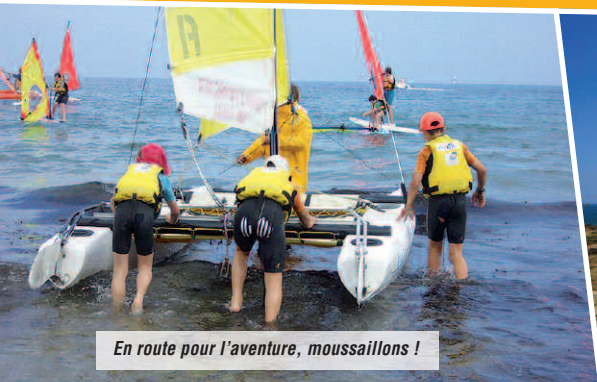
En route pour l'aventure, moussaillons !

● Jeux collectifs et veillées. Pendant le séjour, l'équipe propose des activités et des ateliers lors de temps d'animation « à la carte » ou préparés par tranche d'âges. ■