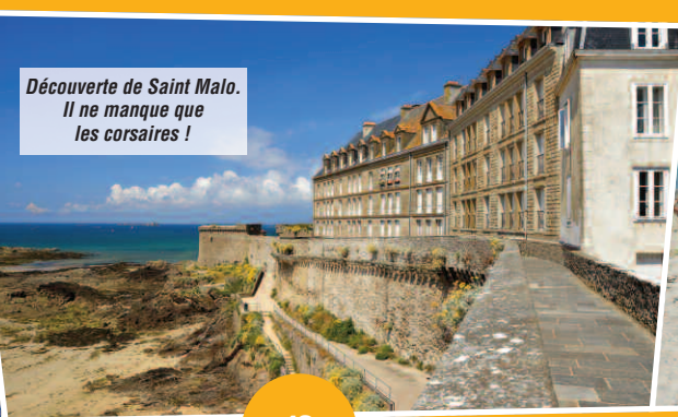
Découverte de Saint Malo. Il ne manque que les corsaires !