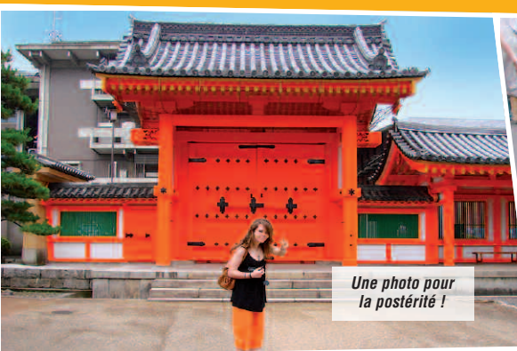
Une photo pour la postérité !