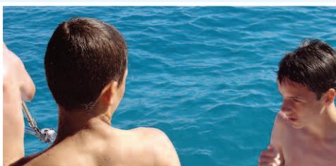
Cette petite crique mérite bien une petite escale... A nous la terre ferme !

L'itinéraire est préparé avec les jeunes, mais reste modifiable en fonction des envies de l'équipage, et bien sûr des conditions météorologiques.