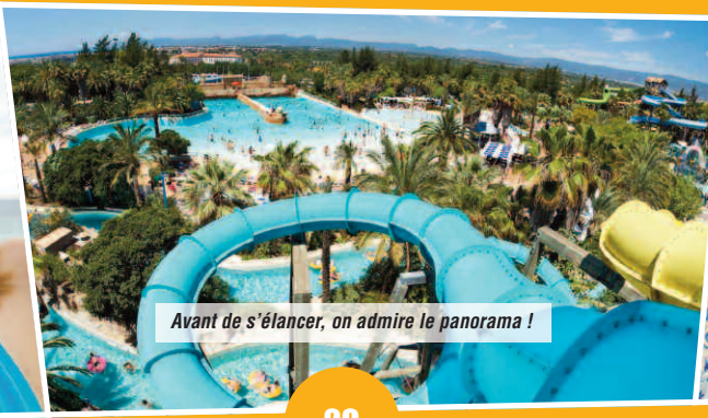
Avant de s'élancer, on admire le panorama !