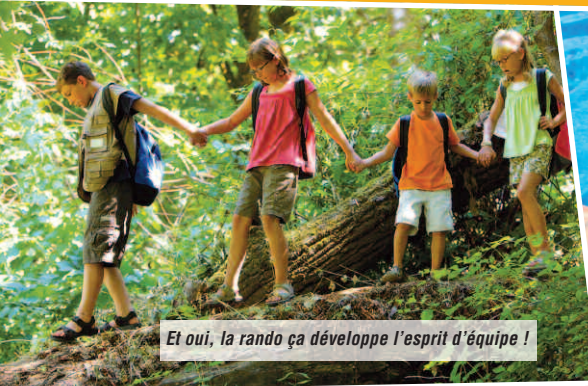
Et oui, la rando ça développe l'esprit d'équipe !

● Autres activités. Visite de la ferme/fromagerie du village, fabrication de confiture, activités manuelles, jeux de société, temps calmes, veillées rythment également le séjour. ■