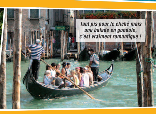
Tant pis pour le cliché mais une balade en gondole, c'est vraiment romantique !