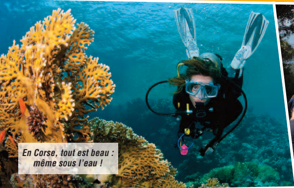
En Corse, tout est beau : même sous l'eau !