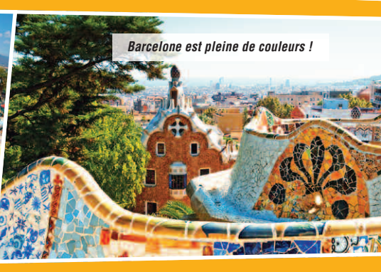
Barcelone est pleine de couleurs !