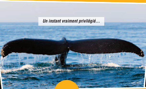
Un instant vraiment privilégié...