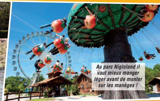
Au parc Nigloland il vaut mieux manger léger avant de monter sur les manèges !