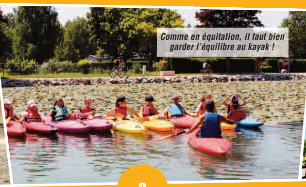
Comme en équitation, il faut bien garder l'équilibre au kayak !