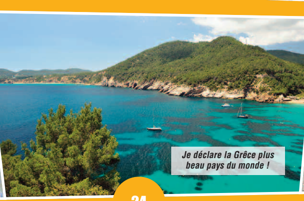
Je déclare la Grèce plus beau pays du monde !