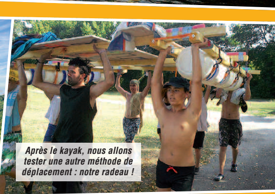
Après le kayak, nous allons tester une autre méthode de déplacement : notre radeau !