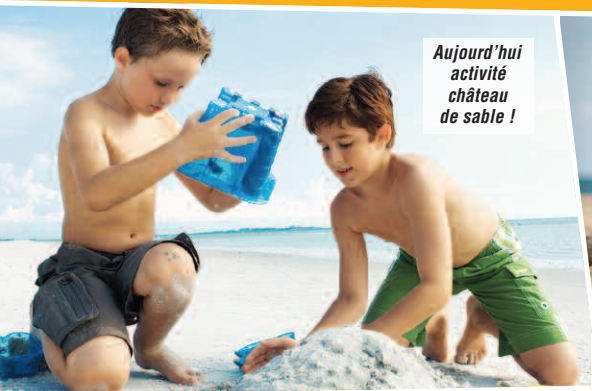
Aujourd'hui activité château de sable !